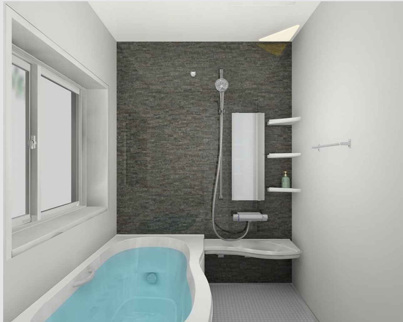
CG合成によるイメージ画像です。